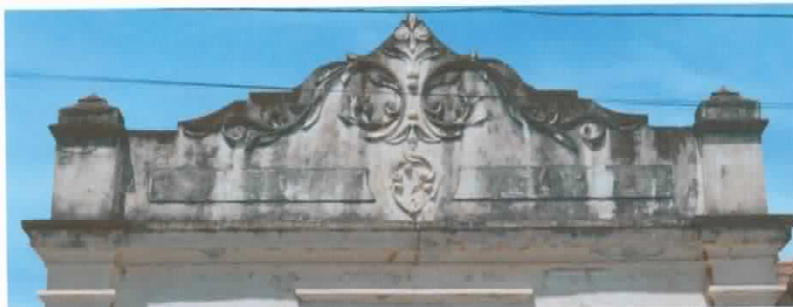
Detalhe da platibanda da ruína na Rua Oswaldo Cruz.