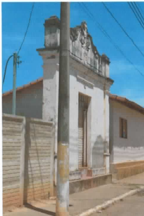
Vista lateral da ruína na Rua Oswaldo Cruz. Fonte: Ana Paula Tavares Miranda e Guilherme Silva Graciano, Set. 2014.