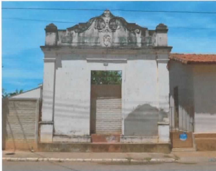
Vista frontal da ruína na Rua Oswaldo Cruz. Fonte: Ana Paula Tavares Miranda e Guilherme Silva Graciano, Set. 2014.